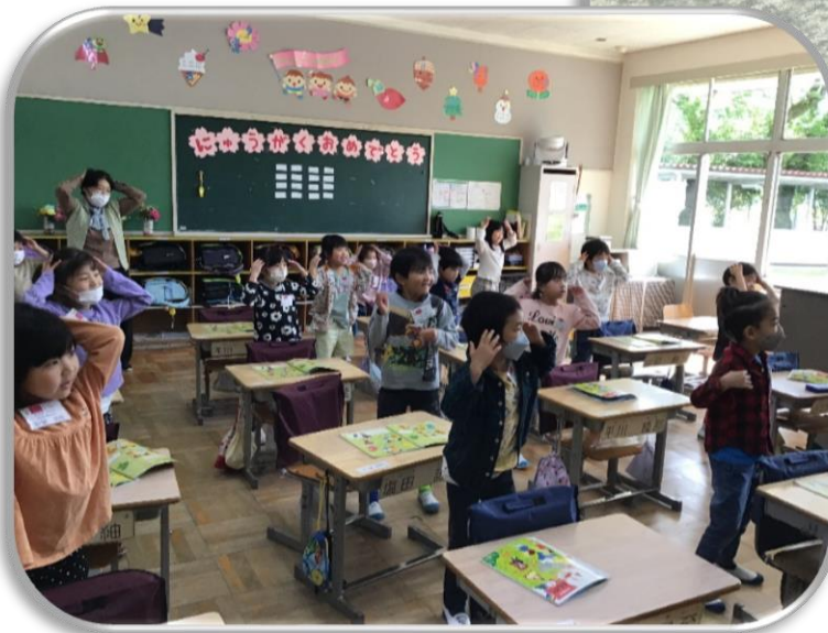
チェックリダンス♪