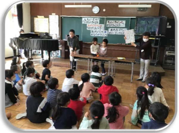
お話玉手箱さんの読み聞かせ